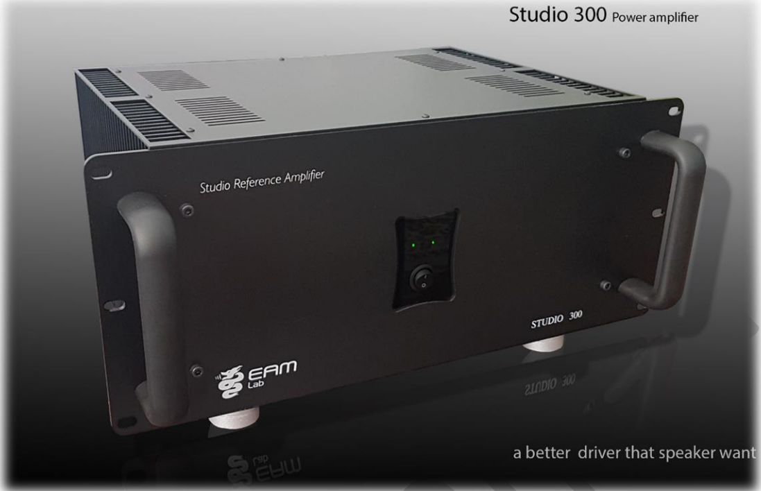
Studio 300 Power amplifier